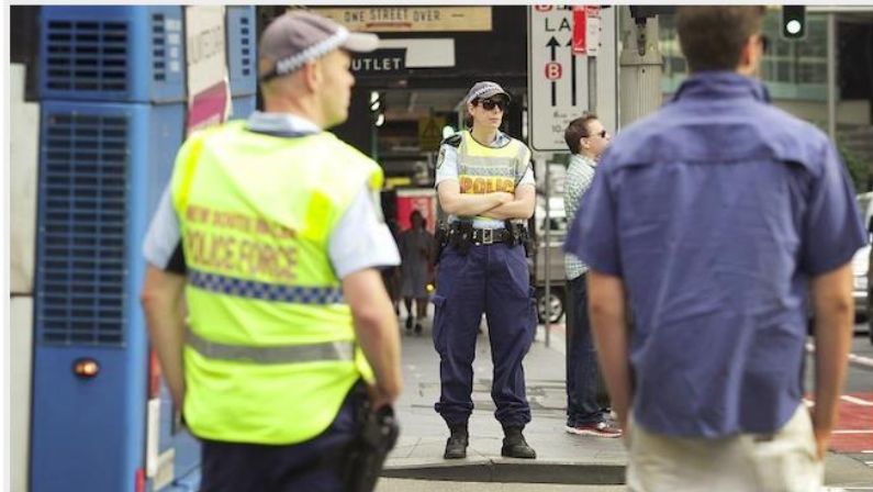
ตำรวจยื่นไฟเห็นจะว่าพร้อมจับ ก็ยังมีคนอุตริข้ามมาใหญ่กปรับจนได้ เมื่อวานนี้กว่า 50 คน

BY STRONGLY55 on SEPTEMBER 5, 2017 · 0 ( 0 )